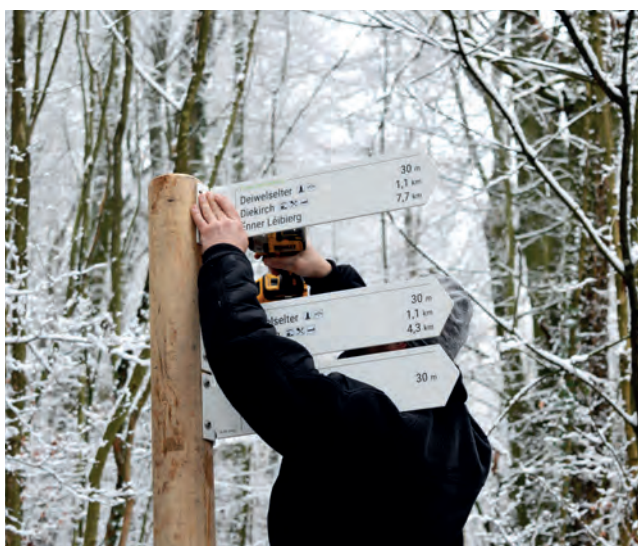
Texte & Fotos: Visit Éislek

Dieses Projekt kann nur dank der intensiven Zusammenarbeit zwischen regionalen Partnern und öffentlichen Trägern umgesetzt werden.