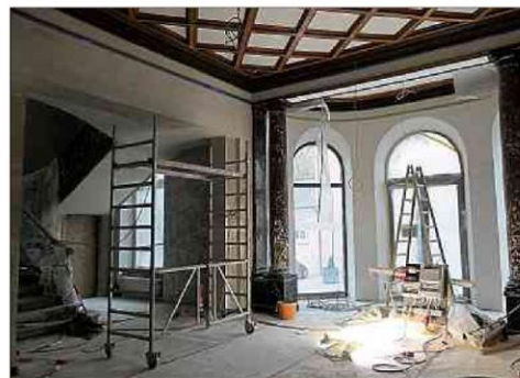
Im Rathaus haben seit mittlerweile vier Jahren die Handwerker das Sagen. Anfang 2021 hofft aber die Gemeinde auf den Wiedereinzug.