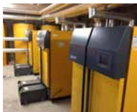
... in Eschweiler