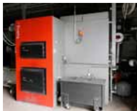
Hackschnitzel-Anlage in der „Kaul“ und ...

Text: François Rossler