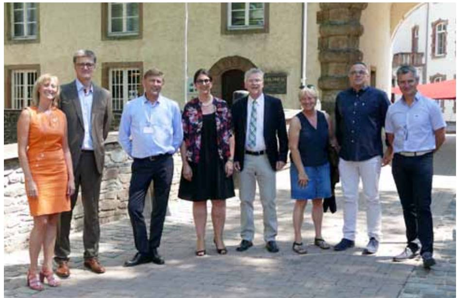
Die Wiltzer Vertreter erwarten die internationalen Gäste.

Es geht darum, clevere Materialflüsse zu entwickeln und ressourcenschonende Geschäftsmodelle sowie einen kollaborativen Konsum (Gegenstände teilen statt besitzen) zwischen den Menschen zu fördern. (Quelle: DoI)