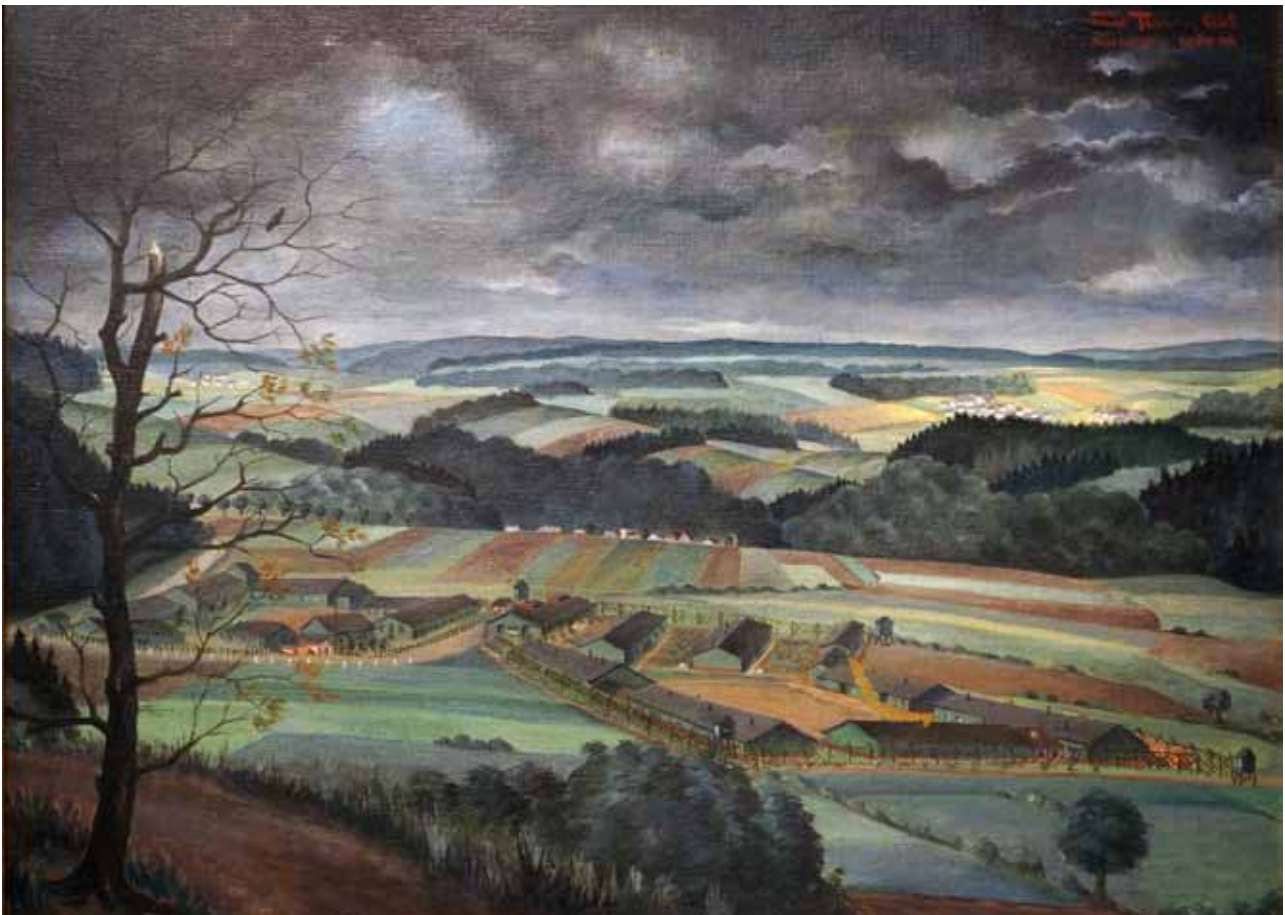
SS- Sonderlager Hinzert