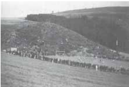
Das erste Spielfeld der „Arminia Weidingen“