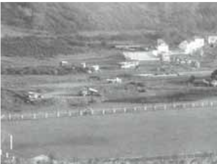
Das 2. Spielfeld „Am Pétz“ befand sich an gleicher Stelle wie das heutige Hauptfeld (Foto: Joss Thein, 1964)

1860, Lausanne Sports, Beveren SK, Austria Salzburg, KSK Lierse, Malmö FF und der FC Malines teilnahmen, wurden zwischen 1972 und 1976 an dieser Stätte ausgetragen.