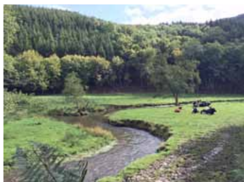
4. Platz Nicole Keiser-Jedrysiak, Mertzig