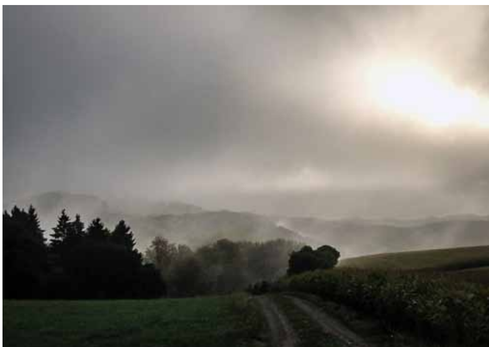
1. Platz Ren Spautz, Angelsberg