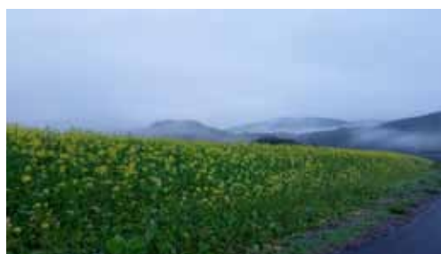
2. Platz Joe Guth, Liefrange